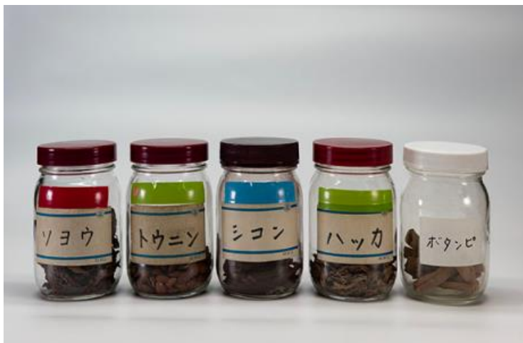
生薬標本（薬学部所蔵）