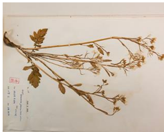
腊葉標本（薬学部所蔵）