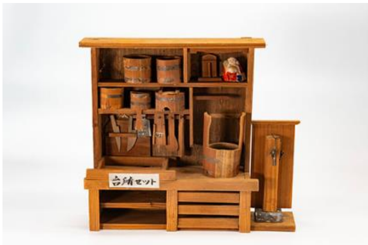
雛道具荒神棚付台所セット