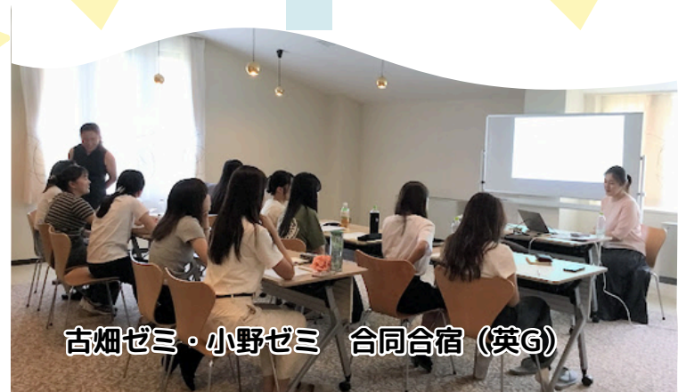
古畑ゼミ・小野ゼミ 合同合宿 (英G)